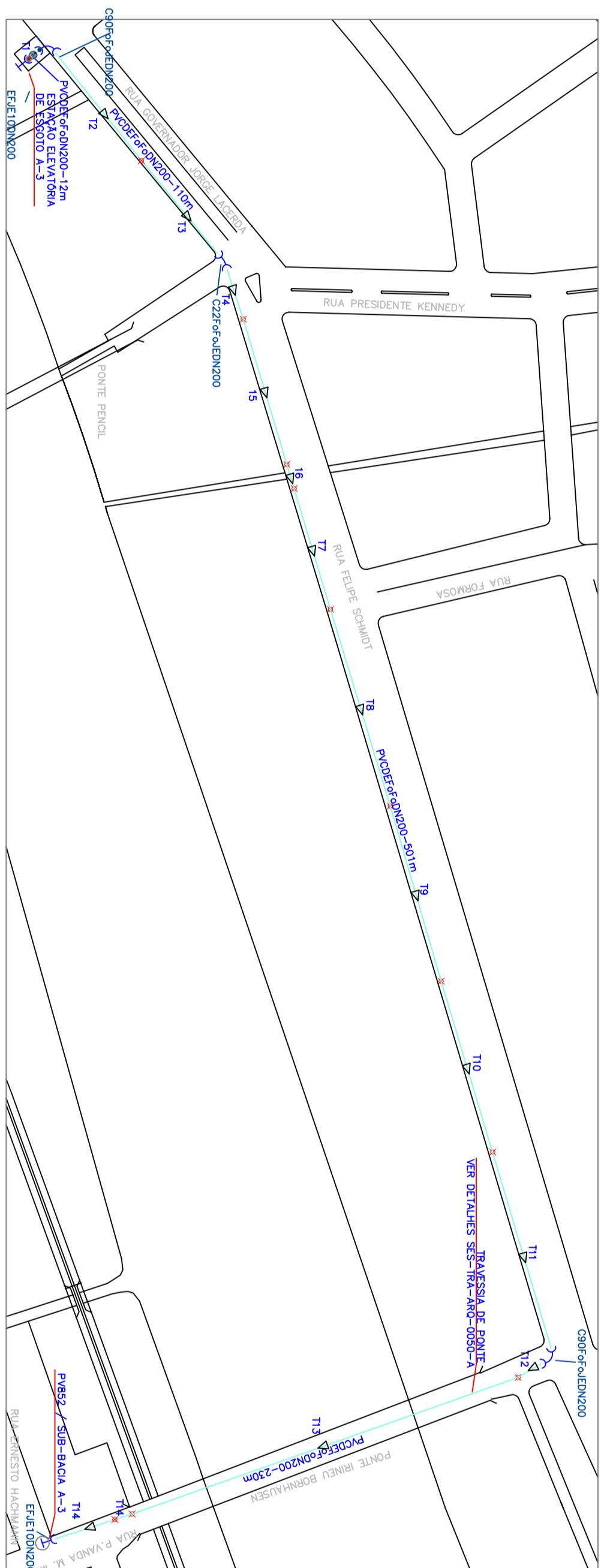
1 PLANTA ESCALA 1:2000