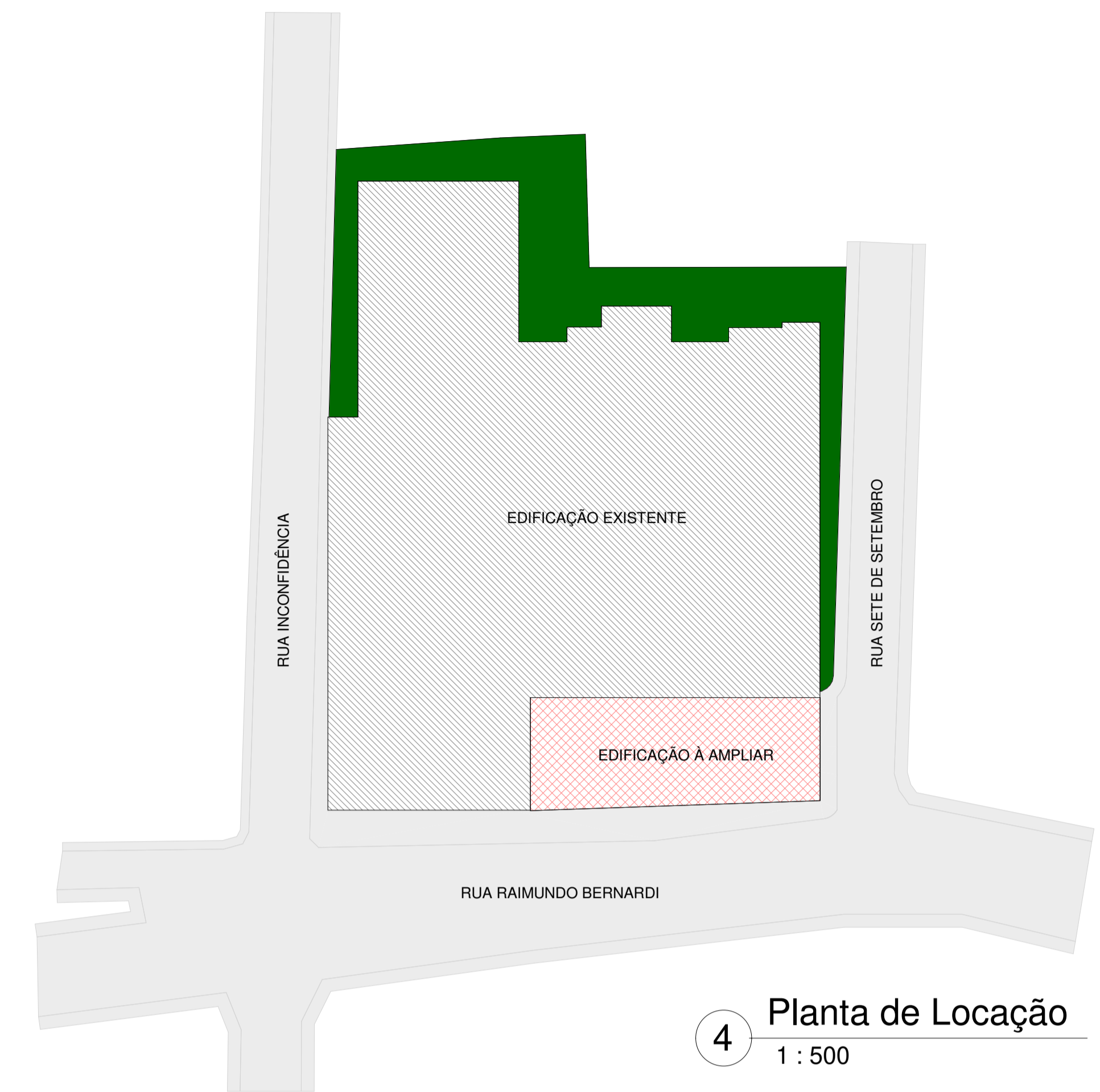
4 Planta de Locação 1 : 500