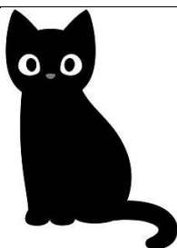
BLACK CAT GATO PRETO