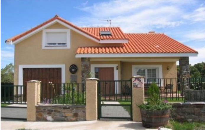
CASA DE TIJOLOS.

AVALIAÇÃO: ENVIAR UMA FOTO DA ATIVIDADE NO WHATS DA PROFESSORA.