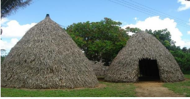
CASA DE PALHA (OCA)