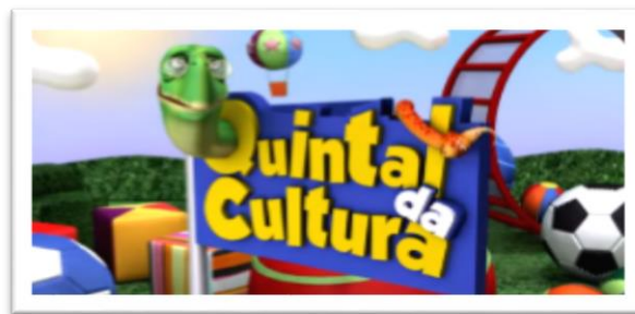
QUINTAL DA CULTURA - BRINCADEIRAS JUNINAS

HTTPS://WWW.YOUTUBE.COM/WATCH? V=GOQRWLXMVQA