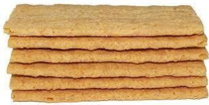
BOLACHA = CROCANTE