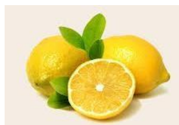
LIMÃO = AZEDO

- A FAMÍLIA PODE ESTIMULAR O BEBÊ A COMER O ALIMENTO, COMENDO-O PRIMEIRO E MANTENDO A ATENÇÃO OCULAR DELE, MAS CASO O BEBÊ NÃO ESTEJA COM VONTADE TENTE EM UM OUTRO MOMENTO, NÃO SE DEVE OBRIGA-LO A FAZER ALGO QUE NÃO QUEIRA.