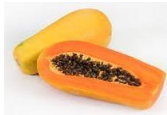
MAMÃO = MOLE