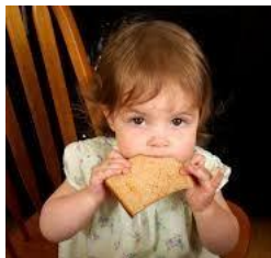
PÃO = SECO