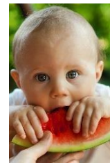
MELANCIA = MOLHADA