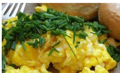
OVO MEXIDO = SALGADO