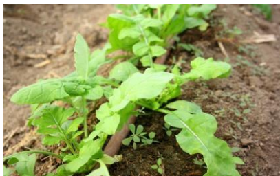
RÚCULA = AMARGO

- DEIXAR O BEBÊ SENTIR O SABOR AZEDO DO ALIMENTO E OBSERVA-LO.