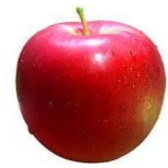
MAÇA = DURO